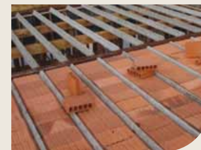
Laje pré-moldada convencional trabalhando em uma direção

São utilizadas em pequenas obras e armadas sempre em uma única direção.