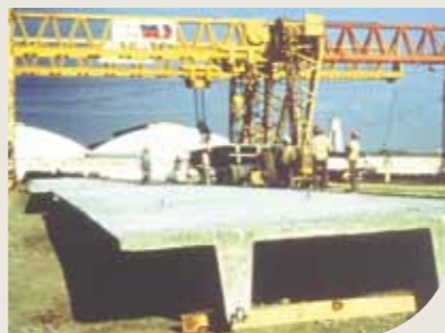
Painel Duplo "T" com protensão nas nervuras

Produzidas pelas indústrias de pré-fabricados, são utilizadas em obras de grande porte, vencem grandes vãos e podem suportar altas sobrecargas.