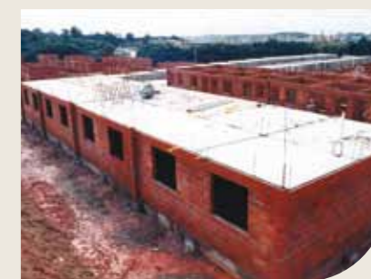
Pré-laje maciça apoiada na alvenaria estrutural

São ideais para conjuntos habitacionais com repetição (padrão CDHU). A principal vantagem é a produtividade na obra.