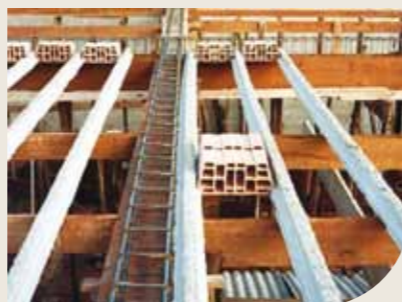
Laje pré-moldada com vigotas protendidas

Armadas em uma única direção, vencem grandes vãos e reduzem significativamente a quantidade de escoramento.