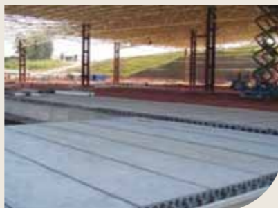
Laje alveolar protendida em grande vão

Geralmente utilizadas em obras pré-moldadas, vencem grandes vãos onde a rapidez da obra é importante.