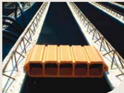
Laje treliçada com elemento de enchimento cerâmico

Podem ser unidirecionais, bidirecionais, minipainéis ou painéis maciços e podem ser aliviadas (elementos de enchimento). Permitem a criação de nervuras transversais à direção da vigota, fácil manuseio, reduzindo o escoramento e a mão de obra.