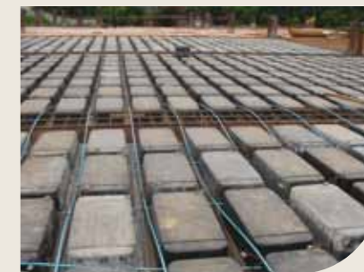
Laje plana nervurada protendida com uma cordoalha por nervura

Geralmente são mais esbeltas, permitindo a redução da quantidade de pilares e o peso da estrutura. Suportam cargas elevadas, maiores vãos e a redução do pé-direito. Requerem mão de obra especializada.