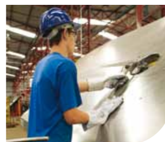
Corte e dobra de aço

A ArcelorMittal conta com uma equipe de técnicos e especialistas para auxiliar na elaboração de soluções para lajes, comprometidos em oferecer aos seus clientes a opção adequada à necessidade da obra. Além do estudo da melhor solução, a ArcelorMittal disponibiliza suporte na elaboração de projetos, softwares, orientação na aplicação de produtos, treinamento de mão de obra e serviços adicionais, como: