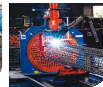
Armadura Pronta Soldada Pré-montagem

A ArcelorMittal também disponibiliza produtos complementares, Espaçadores Treliçados, Arame Recozido e Pregos, de acordo com a necessidade e o cronograma da obra.