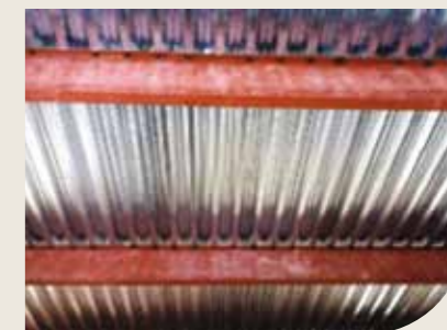
Forma/armação positiva de laje mista da Polydeck59S apoiada em vigas metálicas

Laje constituída por forma metálica para moldagem do concreto, dispensa o uso de forma convencional. Possui nervuras em uma única direção e normalmente é utilizada em estruturas metálicas. Suporta as cargas em toda a vida útil da laje, pois desempenha a função de armadura positiva.